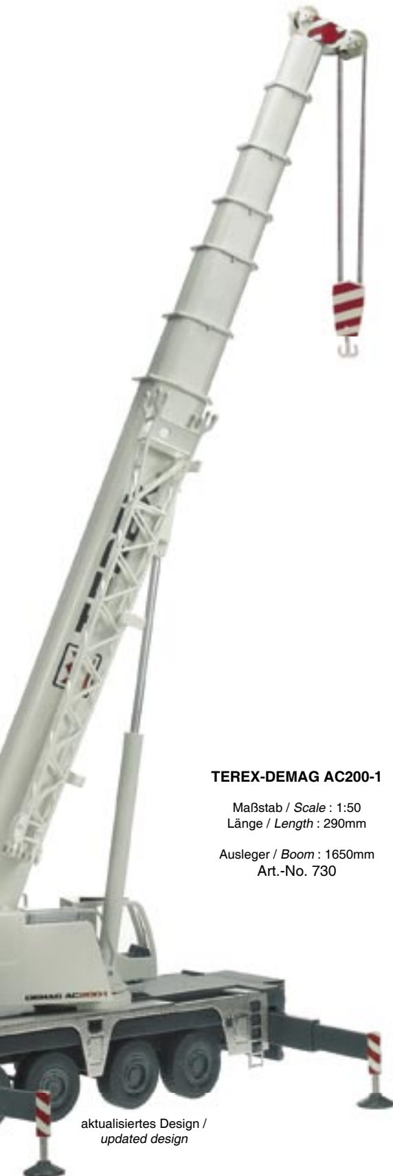
aktualisiertes Design / updated design